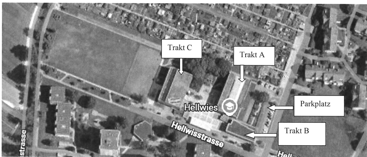
Bild: Schulanlage Hellwies

Mit einer neuen Vordachkonstruktion mit Sitzgelegenheit, einer neuen Parkierung und einer Instandsetzung der Spielplätze wurden die Umgebung aufgewertet.