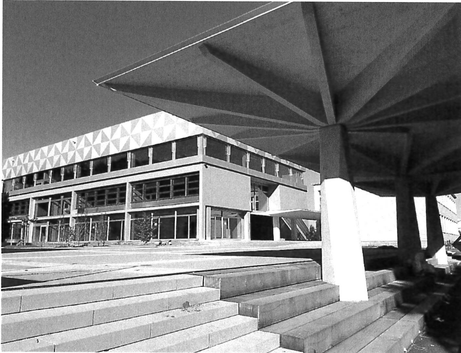
Trakt A mit Aufstockung, gedeckter Pausenplatz