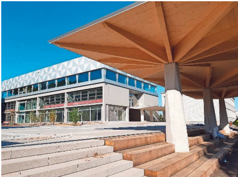
Trakt A mit Aufstockung, gedeckter Pausenplatz.